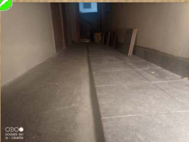
Krótką 10 - remont klatki schodowej.