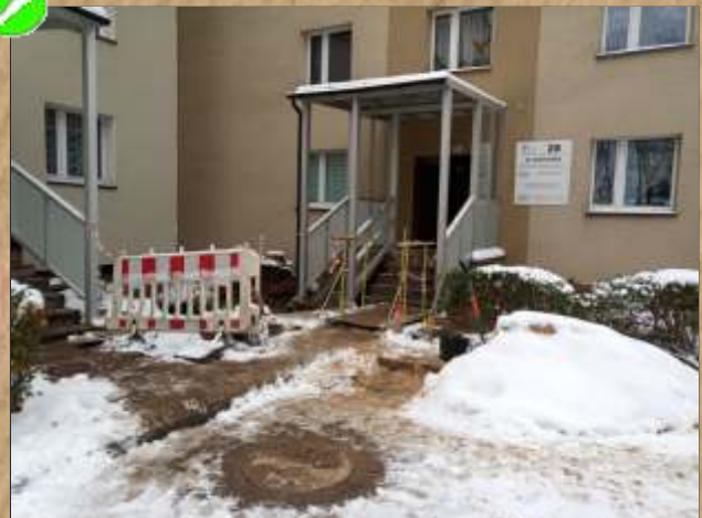
Katowicka 24-28 - remont chodnika.