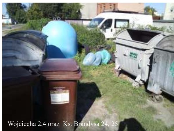
Wojciecha 2,4 oraz Ks. Brandysa 24, 25