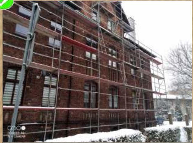
Bytomska 5 - wymiana poszycia dachu.