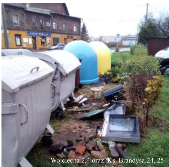
Wojciecha 2,4 oraz Ks. Brandysa 24, 25