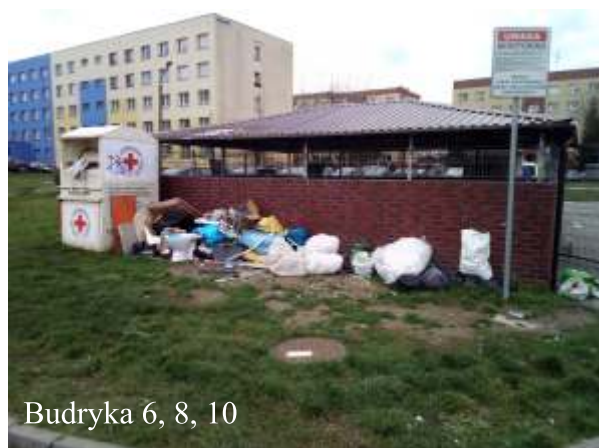
Budryka 6, 8, 10