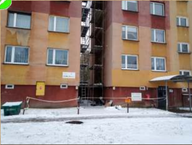
Bohaterów Września 1-2 - remont przejścia ewakuacyjnego pomiędzy budynkami.