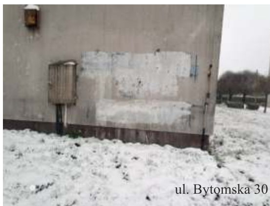
ul. Bytomska 30

W andalizm – w ostatnim czasie odnotowaliśmy kilka aktów wandalizmu na naszych osiedlach. Mieszkańcy ul. Bytomskiej zwrócili się także z pismem o interwencję w tej sprawie. Graffiti na osiedlowych murach to niestety wciąż częste zjawisko. Sprawcy niejednokrotnie pozostają nieznani i bezkarni ponieważ trudno przyłapać ich na gorącym uczynku a miejski monitoring obejmuje jedynie fragmenty naszego miasta. Ostatnie przypadki wandalizmu zanotowaliśmy na ul. Bytomskiej (Michałkowice) oraz pomiędzy ul. Michałkowicką a Kościuszki w centrum Siemianowic Śląskich.